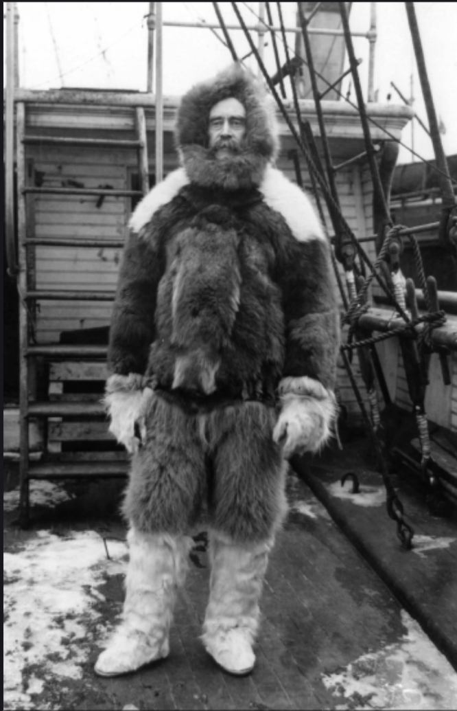
El comandante Robert Peary