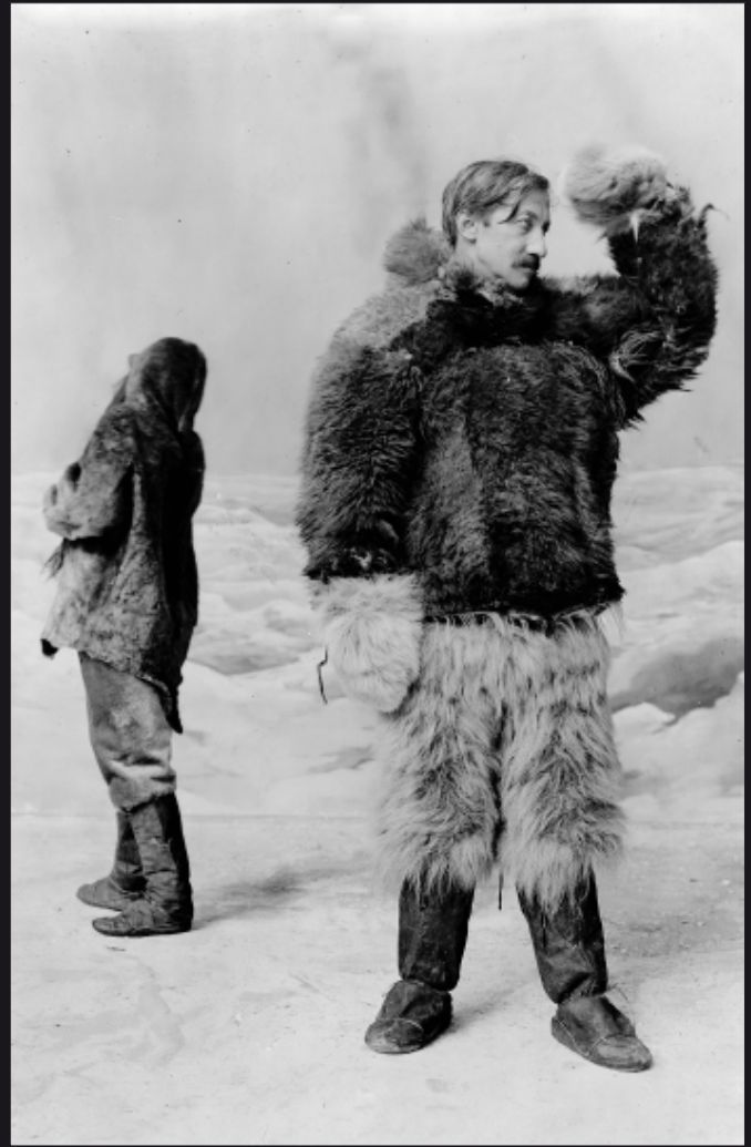
El Dr. Frederick Cook